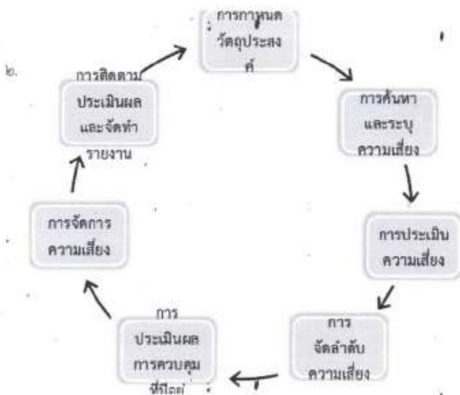
รูปที่ ๓ กระบวนการบริหารความเสี่ยง